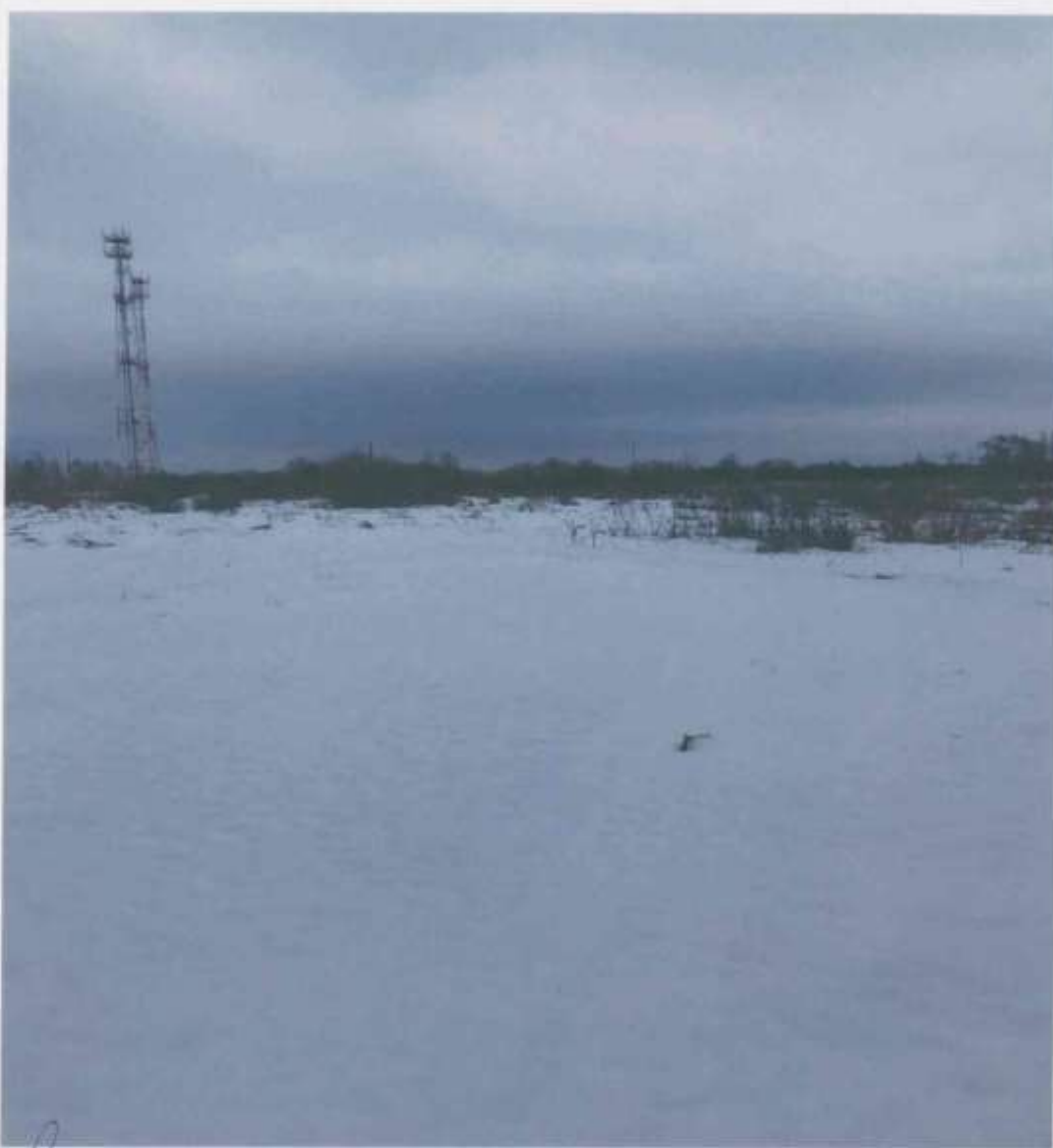
ФОТО № 1

обл.Московская, Лотошинский р-н, п.Торфяной, Российская Федерация, городской округ Лотошино (адрес земельного участка)